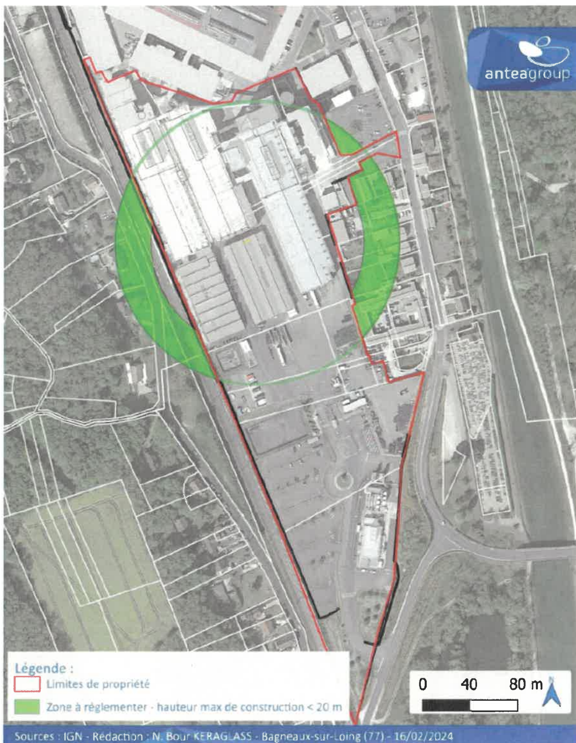
Carte n°2 : Plan délimitant la zone verte

Annexe I à l'arrêté préfectoral n°2024-07/DCSE/BPE/IC du 26 février 2024 fixant le périmètre et les servitudes d'utilité publique instituées autour du site industriel de la société KÉRAGLASS située rue Saint-Laurent sur la commune de Bagneaux-sur-Loing (77 167)